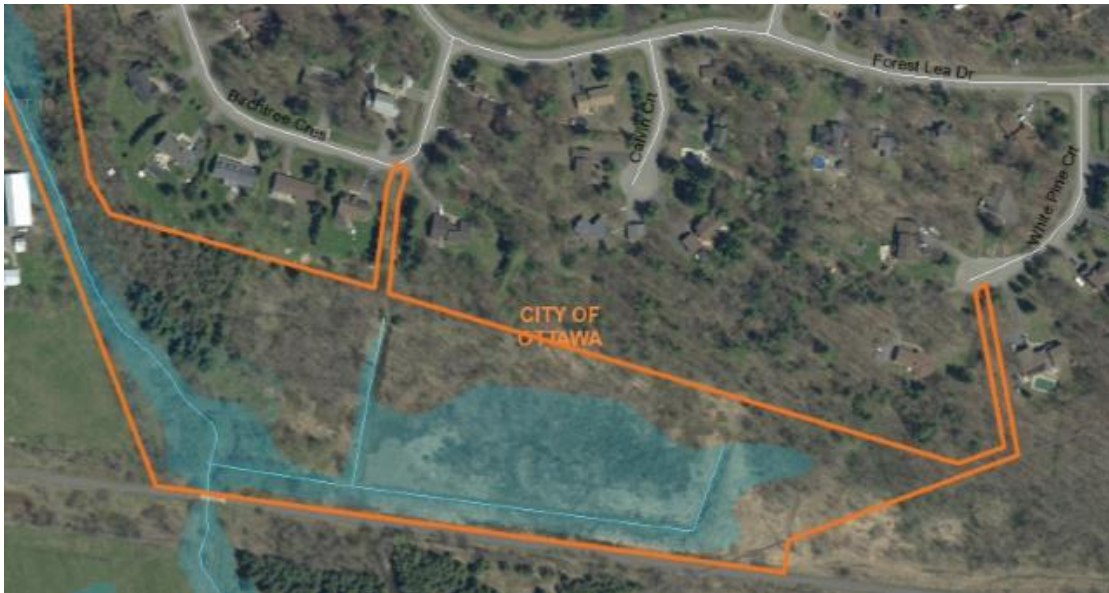
Figure 1 – Projet de mise en valeur communautaire à Navan – habitat naturel et sentiers de la nature au 999 chemin Smith.